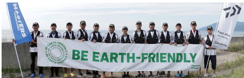
1st ダイワ キスマスターズ 2016 全国決勝大会 出場13選手(秋田県・八峰町/峰浜)