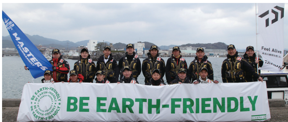
第26回ダイワ グレマスターズ2018 全国決勝大会 出場選手(長崎県 五島・福江)

※プレミアムシード権 優勝経験2度につき1回シード選手として登録します。(但し全国決勝大会に出場できなかった翌年以降に出場できます)