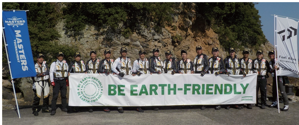
2017年度 第25回ダイワ グレマスターズ2017 全国決勝大会 出場選手(和歌山県・串本)

※プレミアムシード権 優勝経験2度につき1回シード選手として登録します。(但し全国決勝大会に出場できなかった翌年以降に出場できます)