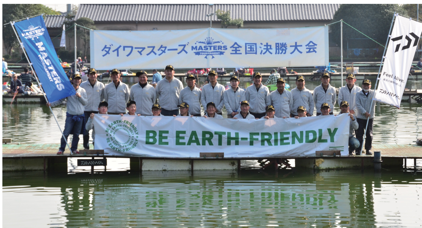
ダイワへらマスターズ2016 全国決勝大会 出場24選手(茨城県・友部湯崎湖)