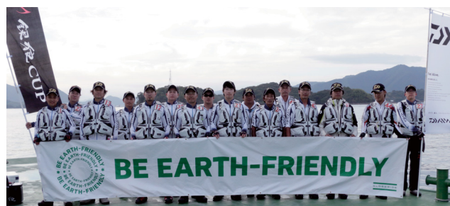
2017年度 第2回ダイワ銀狼カップ 全国決勝大会 出場16選手 (広島県尾道市因島/しまなみ諸島)