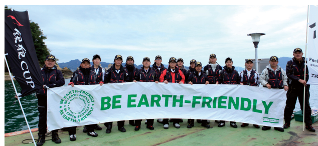
2016年度 第1回ダイワ銀狼カップ 全国決勝大会 出場16選手 (広島県尾道市因島/しまなみ諸島)