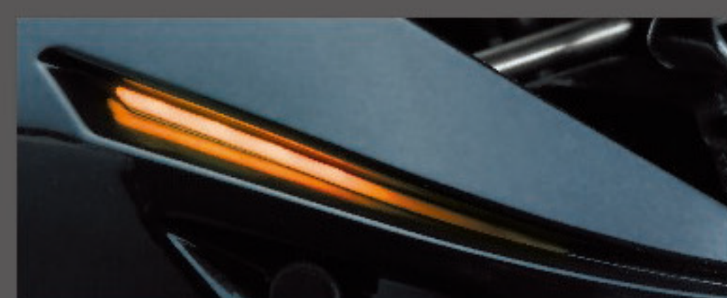
PE LONG CAST MODE LED: オレンジ

“成長したIM Z”でぜひ、昨日までの限界を超えるロングキャストをぶっ放してほしい。